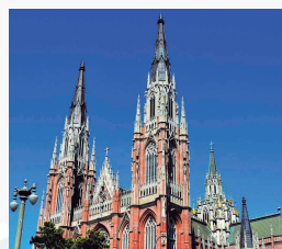
CATEDRAL LA PLATA