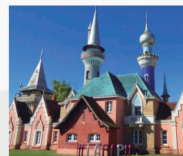
REPUBLICA DE LOS NIÑOS