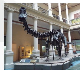
MUSEO CS. NATURALES