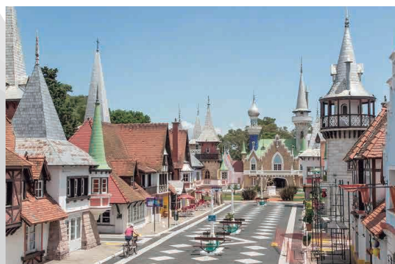
REPUBLICA DE LOS NIÑOS